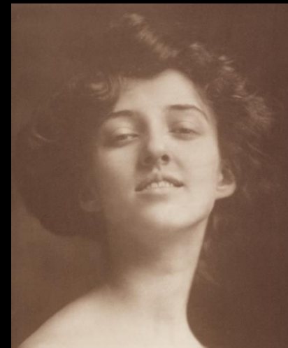
לְעֵג derision v. 4