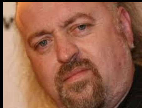
שֵׂאֵט נִפְּשׁ utter contempt v. 5