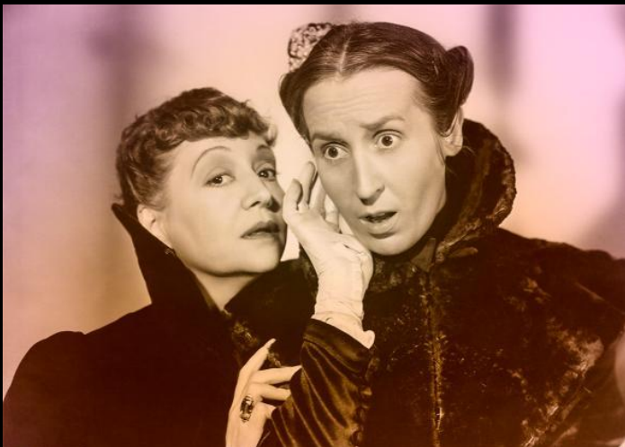
דְּבָרָה calumny v. 3